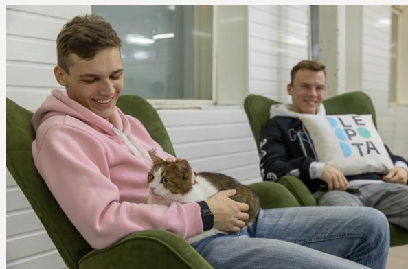
Экосистема благополучия сотрудников "Лепота"