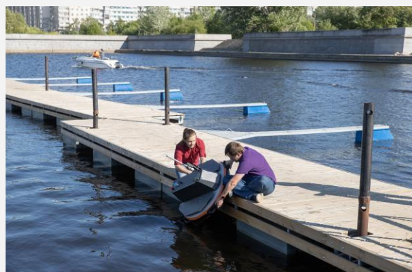
Проект по биологической реабилитации водоемов