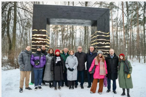
ООП "Экодизайн архитектурной среды"