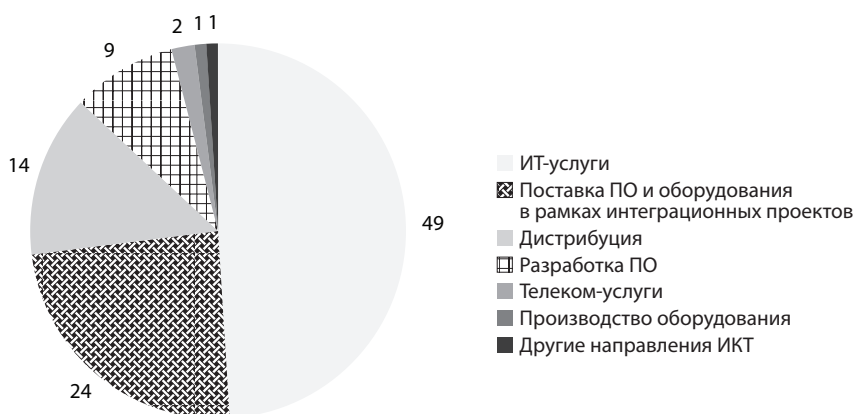
График 2. Структура выручки участников рэнкинга, %*