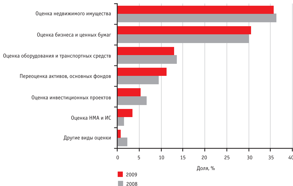
График 3. Структура выручки участников рейтинга в 2009 и 2008 годах. Распределение доходов участников рейтинга за год практически не изменилось