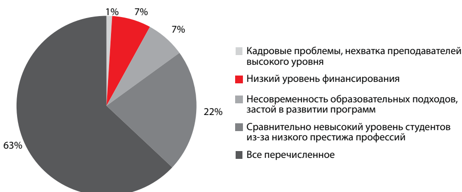
График 3. Что препятствует, по-вашему мнению, росту качества подготовки по массовым социально значимым направлениям (учителя, врачи, агрономы)?