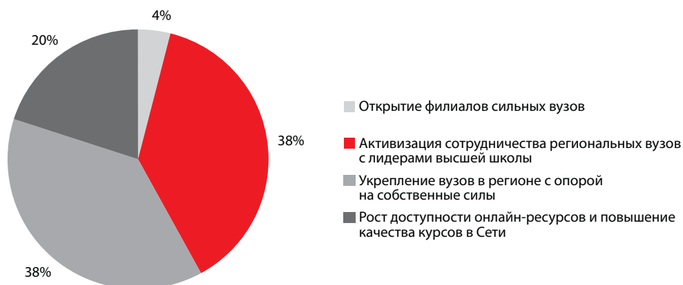
График 1. Каков, на ваш взгляд, оптимальный способ повысить доступность качественного образования в регионах?