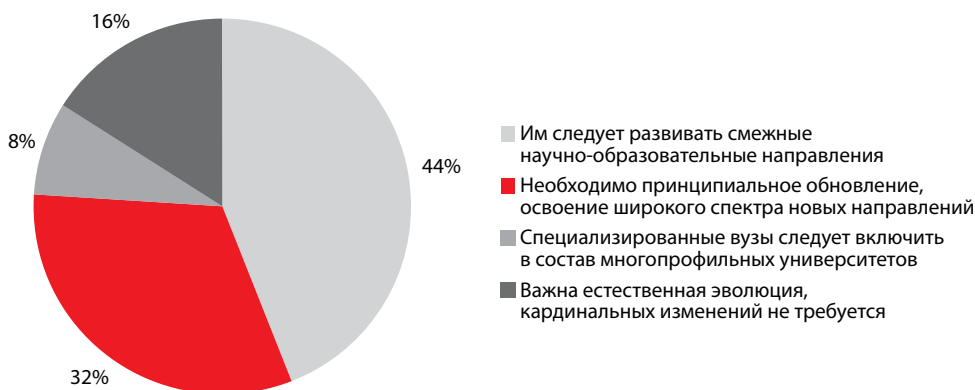
График 2. Какая траектория развития специализированных вузов представляется вам оптимальной?