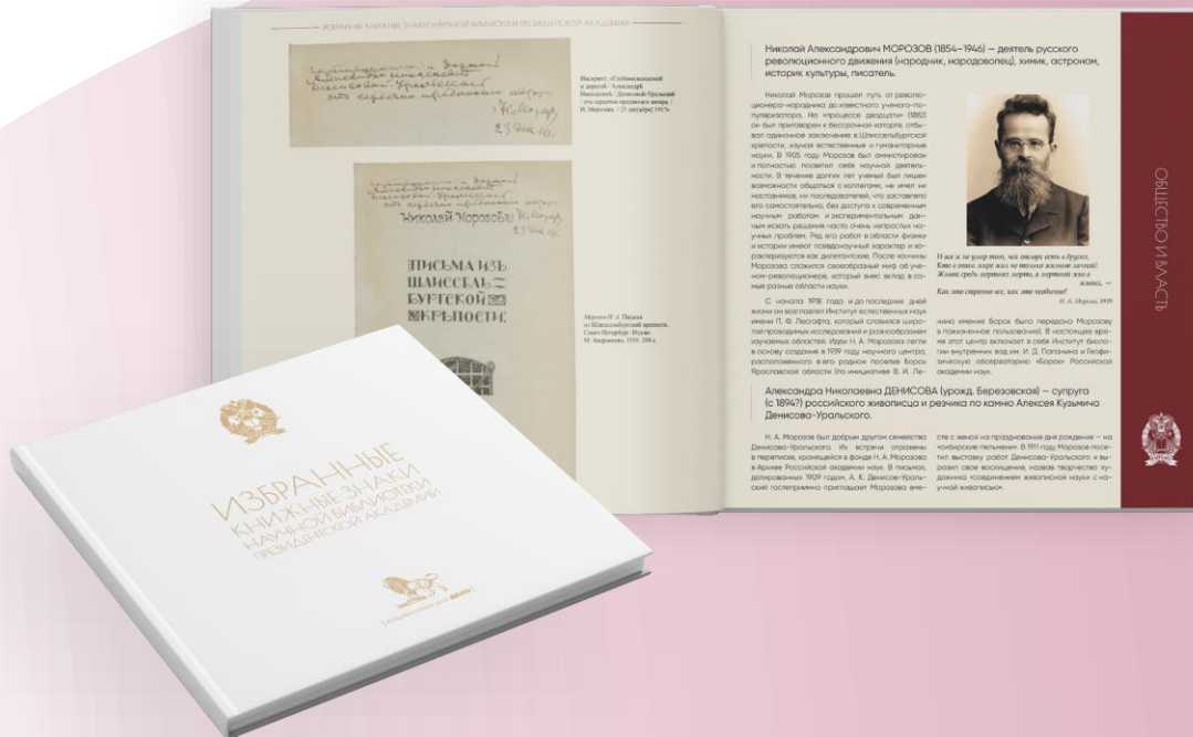
Избранные книжные знаки Научной библиотеки Президентской академии

Примеры научных изданий на основе материалов фондов библиотеки: