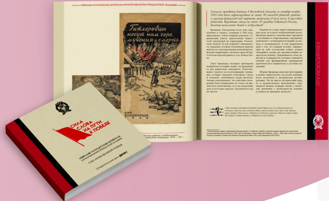
Сила слова на пути к Победе: Избранные агитационные материалы Научной библиотеки Президентской академии