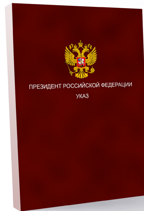
Указ Президента №309 от 24.05.2024 г.