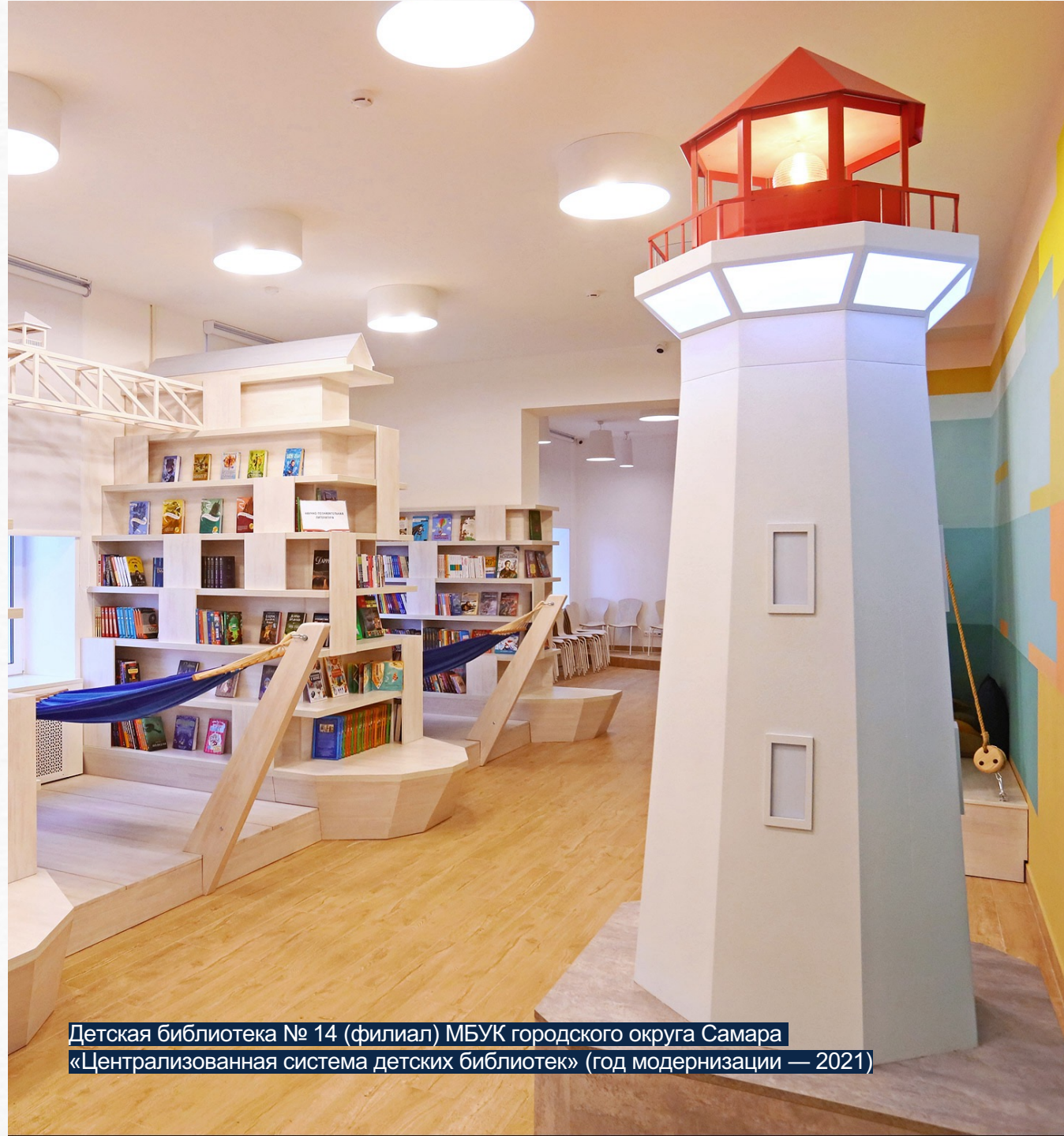
Детская библиотека № 14 (филиал) МБУК городского округа Самара «Централизованная система детских библиотек» (год модернизации — 2021)

Координатор — Проектный офис на базе Российской государственной библиотеки