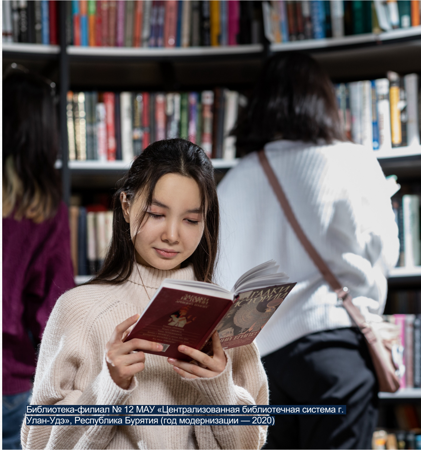
Библиотека-филиал № 12 МАУ «Централизованная библиотечная система г. Улан-Удэ», Республика Бурятия (год модернизации — 2020)

+ 55 % к количеству посещений, что составило 46 129 015 (на 01.01.2025)