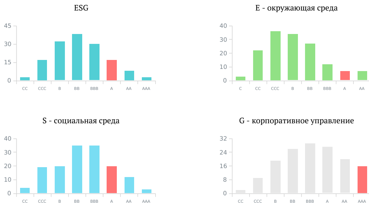
График 1. ESG-рейтинг (сравнение с компаниями, входящими в ESG-базу RAEX по состоянию на 20.04.2026 г.)

ESG-рейтинг RAEX A[esg] - A[e], A[s], AAA[g]