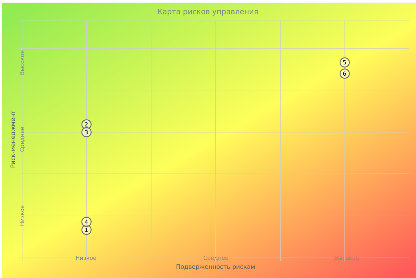
График 5. Карта рисков управления