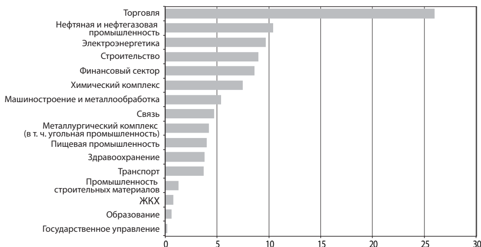
График 3. Распределение выручки участников рэнкинга, заработанной в рассматриваемых секторах экономики (доля, %)*

* Без учета выручки, отраженной участниками при анкетировании в разделе «Прочие отрасли» (5,4 млрд рублей).