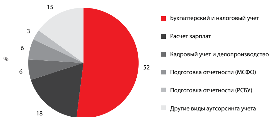
График 1. Структура выручки участников рэнкинга по итогам 2016 года