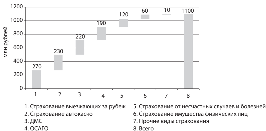
График 2. Прирост взносов по директ-страхованию в разрезе видов страхования, 2014 год

В номинальном выражении объем директ-страхования вырос на 1,1 млрд рублей. Наибольший вклад в прирост внесли страхование выезжающих за рубеж (+270 млн рублей), страхование автокаско (+230 млн рублей) и ДМС (+220 млн рублей). Активнее всего росли страхование от несчастных случаев и болезней (60%), страхование выезжающих за рубеж (57%) и страхование имущества физических лиц (46%).